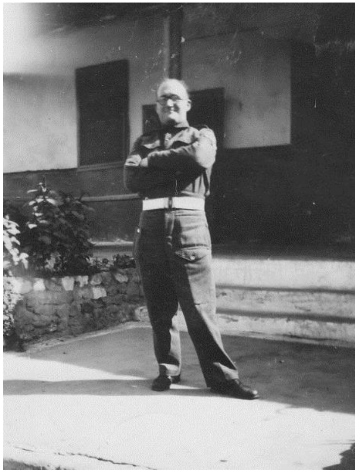
Ο Άλμπερτ Μέλτσερ στο Κάιρο το 1947

Πιθανώς όμως η διαρκέστερη κληρονομιά του Άλμπερτ είναι η Βιβλιοθήκη Kate Sharpley, προφανώς το πιο περιεκτικό αναρχικό αρχείο στη Βρετανία.