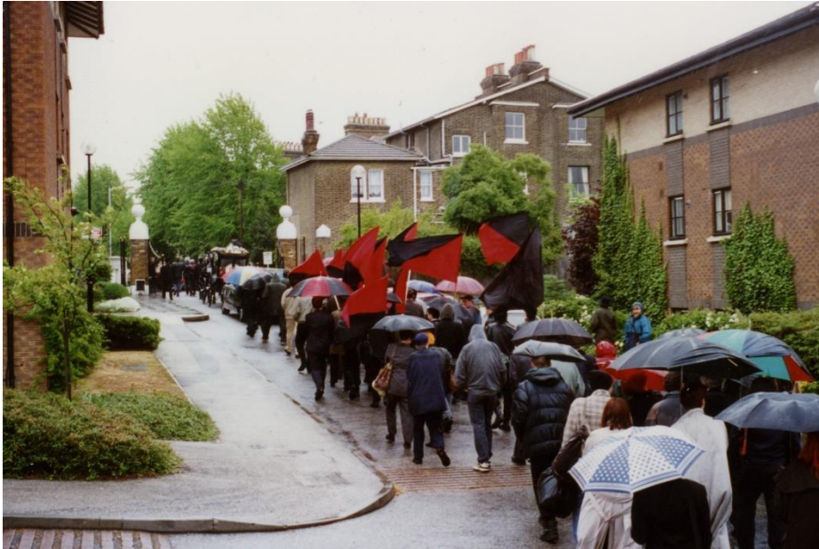
Οι μαυροκόκκινες ανεμίζουν στην κηδεία του Άλμπερτ Μέλτσερ

Ο Αναρχικός Άλμπερτ Μέλτσερ γεννήθηκε στις 7 Ιανουαρίου του 1920. Πέθανε στις 7 Μάη 1996.