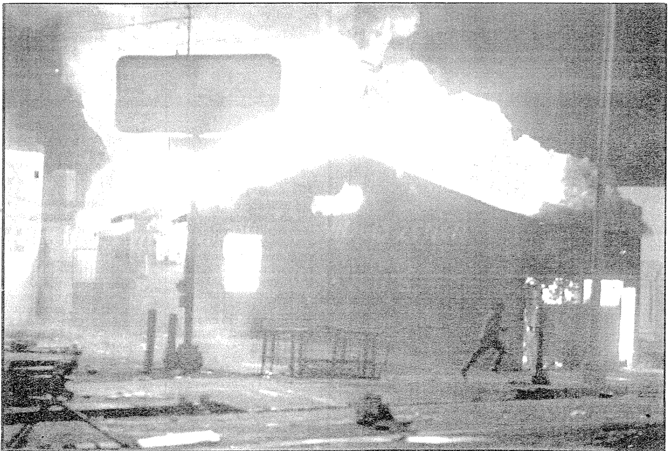
Παίζοντας με τη φωτιά (Watts, 1992): η κριτική του εμπορεύματος και της πολεοδομίας συνεχίζεται.

Το ζήτημα της βίας που σχετίζεται άμεσα με τις πρόσφατες εξεγέρσεις στο L.A. και τις παλαιότερες στην Ευρώπη είναι αρκετά περίπλοκο. Οι εξεγέρσεις σίγουρα δε μπορεί να περιγραφούν με τρόπο ρομαντικό ή αποθεωτικό. Η κατανόηση και ανάλυση των αντιφάσεων της καθημερινής ζωής -που τη στιγμή των συγκρούσεων παρουσιάζονται ιδιαίτερα έντονες και δραματικές- θα βοηθήσει στην αποτελεσματικότερη οργάνωση εκείνων που μέσα από μια επαναστατική προοπτική παλεύουν για την κατάρτιση των εξουσιαστικών και εμπορευματικών σχέσεων. Αναγνωρίζοντας