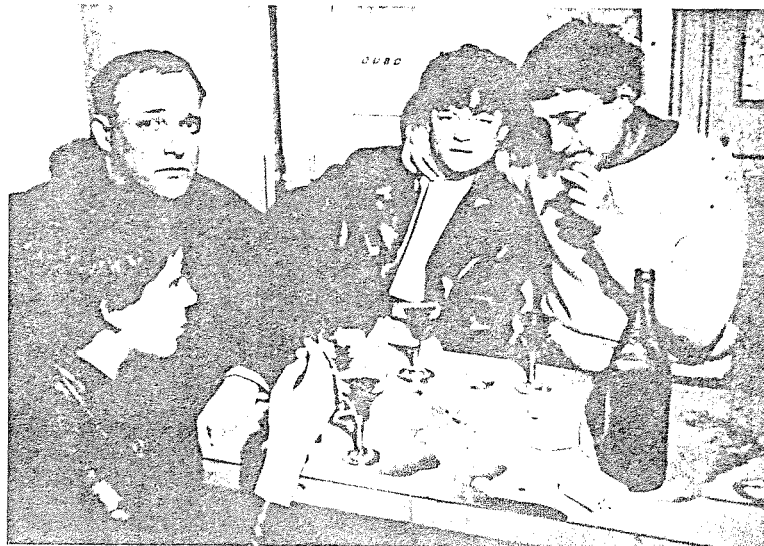
Σε κάθε στιγμή λοιπόν οι ομάδες και τα άτομα βρίσκονται μπροστά σε ανεπιθύμητα αποτελέσματα.

Αναμφίβολα σε μια έξαρση επαναστατικότητας η Beck's, εταιρεία κατασκευής και ομώνυμη μάρκα μπύρας, ανέλαβε τη χρηματοδότηση της έκθεσης στο ICA. Δε θάπρεπε να μας ξαφνιάσει λοιπόν αν προσεχώς η εν λόγω εταιρεία χρησιμοποιήσει μια διαφήμιση σαν και αυτήν: