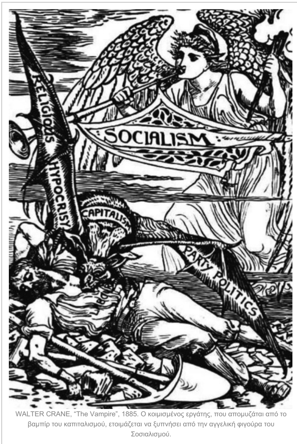
WALTER CRANE, "The Vampire", 1885. Ο κοιμισμένος εργάτης, που απομυζάται από το βαμπίρ του καπιταλισμού, ετοιμάζεται να ξυπνήσει από την αγγελική φιγούρα του Σοσιαλισμού.