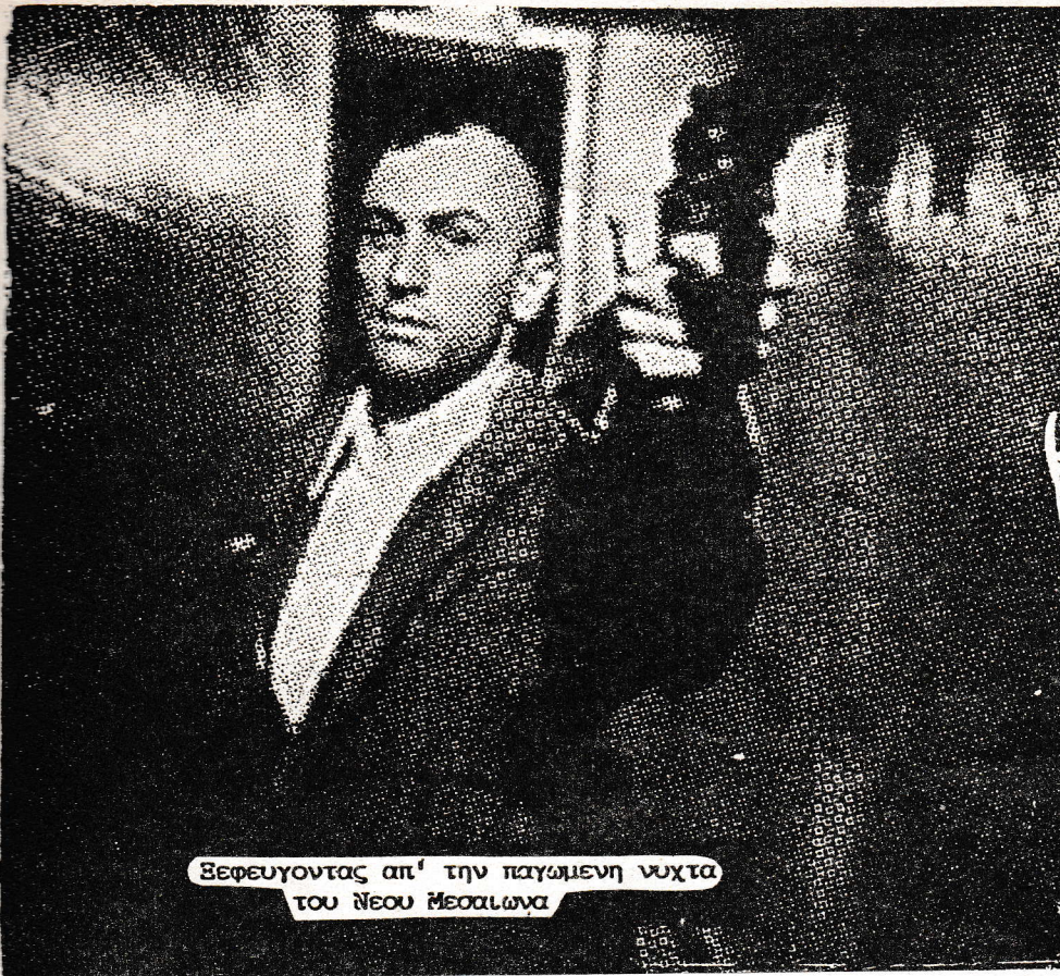
Ξεφευγοντας απ' την παγωμενη νυχτα του Νεου Μεσαίωνα