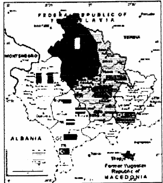
Ο χάρτης του Κοσσυφοπεδίου, με τις ζώνες κατοχής των "ελευθερωτών" του, το 2000...