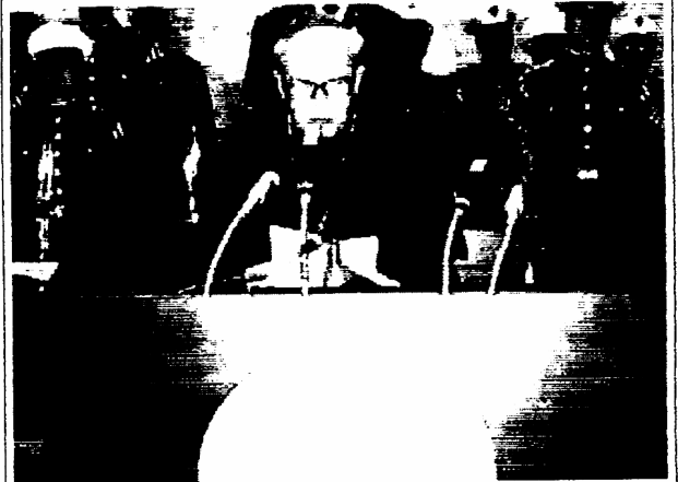
1995 : Ο καθολικός επίσκοπος της Σλοβακίας, στα εγκαίνια του Ραδιοφωνικού Σταθμού "Ελεύθερη Ευρώπη", υπό το άγρυπνο βλέμμα των αμερικάνων πεζοναυτών "ελευθερωτών"...

ΛΥΣΕΙΣ ΠΡΟΗΓΟΥΜΕΝΟΥ ΣΤΑΥΡΟΛΕΞΟΥ (No.1 - τ.172) ΟΡΙΖΟΝΤΙΑ : 1. ΦΡΟΥΡΙΟ - ΟΛ 2. ΘΑΥΜΑ - ΥΤΡΟ 3, Ο ΒΡΑΧΟΣ - ΓΡ 4, ΡΑ - ΚΑΚ (Κοινοπολιτεία των Ανεξαρτήτων Κρατών) - ΝΟΚ (ΚΟΝ) 5. ΕΣΑ - ΟΤΥΑ (ΑΥΤΟ) 6. ΣΟΥΠΙΑ - ΡΕ 7. ΛΛΕ - ΣΧΟΛΗ 8. ΙΡΗΤΟΠ (ΠΟΤΗΡΙ) 9. ΩΤΚΑΝΑ (ΑΝΑΚΤΩ) - ΗΠΑ 10. ΟΝΟΡΕ - ΑΠ (Άρειος Πάγος).