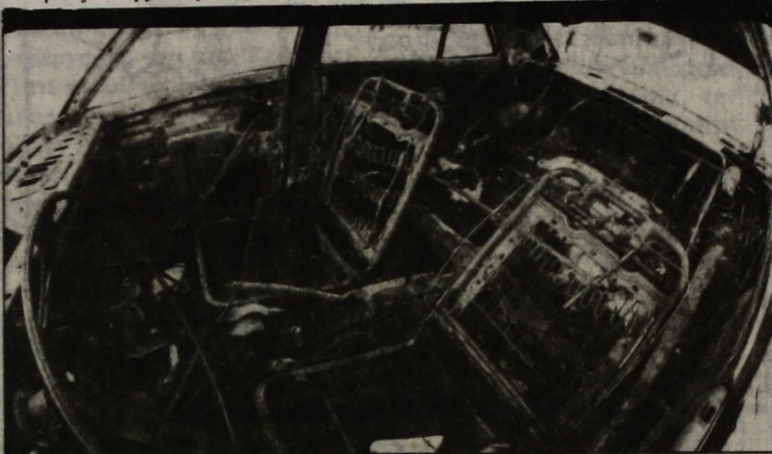
Στάχτη το περιπολικό.

Το κράτος κρατούσε πάντοτε τις αναγκαίες αποστάσεις ασφάλειας από τους αναρχικούς της συμπρωτεύουσας θέλοντας να αποφύγει πάση θυσία μια σύγκρουση μ' αυτούς, όχι φυσικά γιατί «φοβόταν» την αντιπαράθεση με μια αδύναμη εξάλλου ως ανύπαρκτη δυναμική ενός ανύπαρκτου «κοινωνικού αντάρτικου», αλλά γιατί ακριβώς το ίδιο δεν ήθελε να ρίξει «λάδι στη φωτιά» αναζωπυρώνοντας τις ελάχιστες ενδείξεις ενός τέτοιου ενδεχόμενου. Αυτή η τακτική υπαγορεύονταν και από την ιδιαίτερη γεωγραφική θέση της Θεσ/νίκης, που σαν τέτοια θα μπορούσε να λειτουργήσει συντονιστικά και αποφασιστικά συσπειρώνοντας τις «σκόρπιες δυνάμεις» της Βόρειας Ελλάδας.