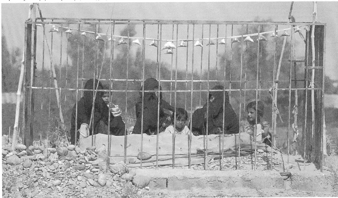
25/7/2009 : Νάουα, επαρχία Χελμάντ, Αφγανιστάν. Η γυναίκα και τα δυο παιδιά κλαίει τον σκοτωμένο άντρα και πατέρα τους.