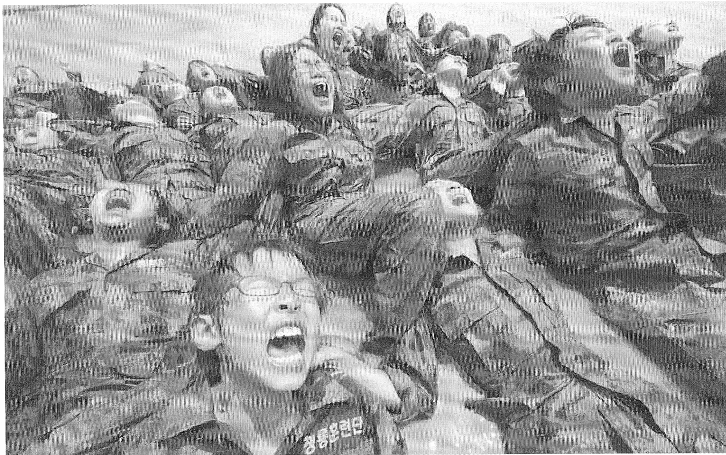
21 Ιουλίου 2009. Λίγο πιο έξω απ' την Σεούλ. Μικροί Νοτιο-Κορεάτες μαθητές του δημοτικού, που παραθερίζουν σε κατασκήνωση οργανωμένη απ' τις ένοπλες δυνάμεις της χώρας «τους», εκδηλώνουν τα ευγενικά αισθήματα που τρέφουν για τους Βορειο-Κορεάτες συνομηλίκους τους.