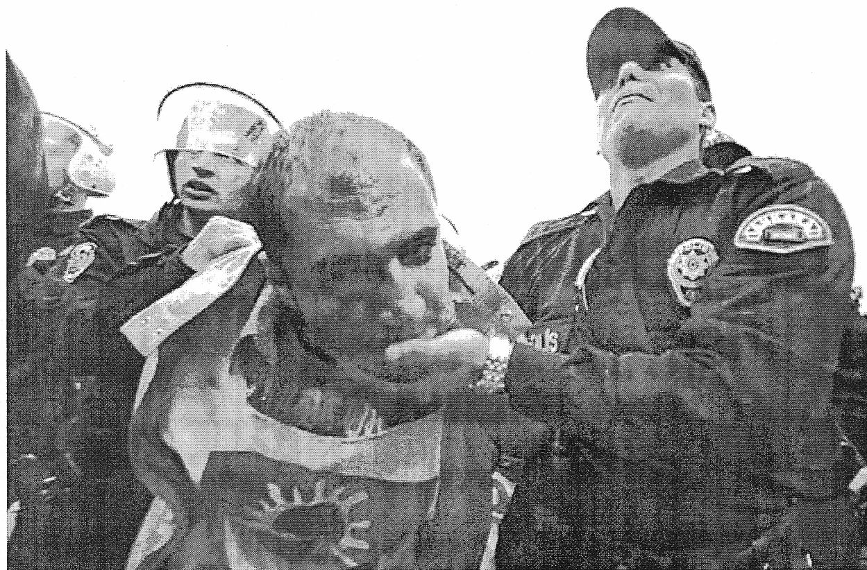
6/4/2009 : Διαδηλωτής κατά του ΝΑΤΟ και της επίσκεψης Obama συλλαμβάνεται στην Αγκυρα.