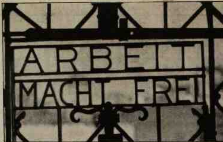
«Η εργασία απελευθερώνει» γραμμένο στην είσοδο του Νταχάου.

Οι αντιρρήσεις και η εχθρότητα της Κομμουνιστικής Αριστεράς απέναντι στον Αντρέα και τη παρέα του έγκειται στο ότι οι δεύτεροι είναι οι μοναδικοί χρήστες των εξουσιαστικών μηχανισμών και όχι η κεντρική επιτροπή του κόμματός τους. Το πρώτο στάδιο του προγράμματος των Κομμουνιστών ό -δημοκρατικός μετασχηματισμός της αστικής κοινωνίας-, για το πέ-