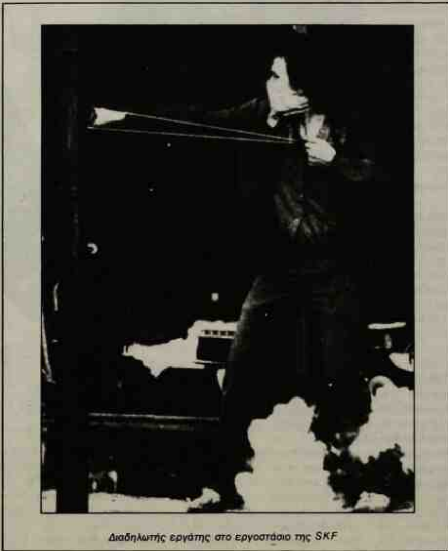
Διαδηλωτής εργάτης στο εργοστάσιο της SKF

Στις διαπραγματεύσεις για λύση στο πρόβλημα της SKF τα στελέχη της CGT