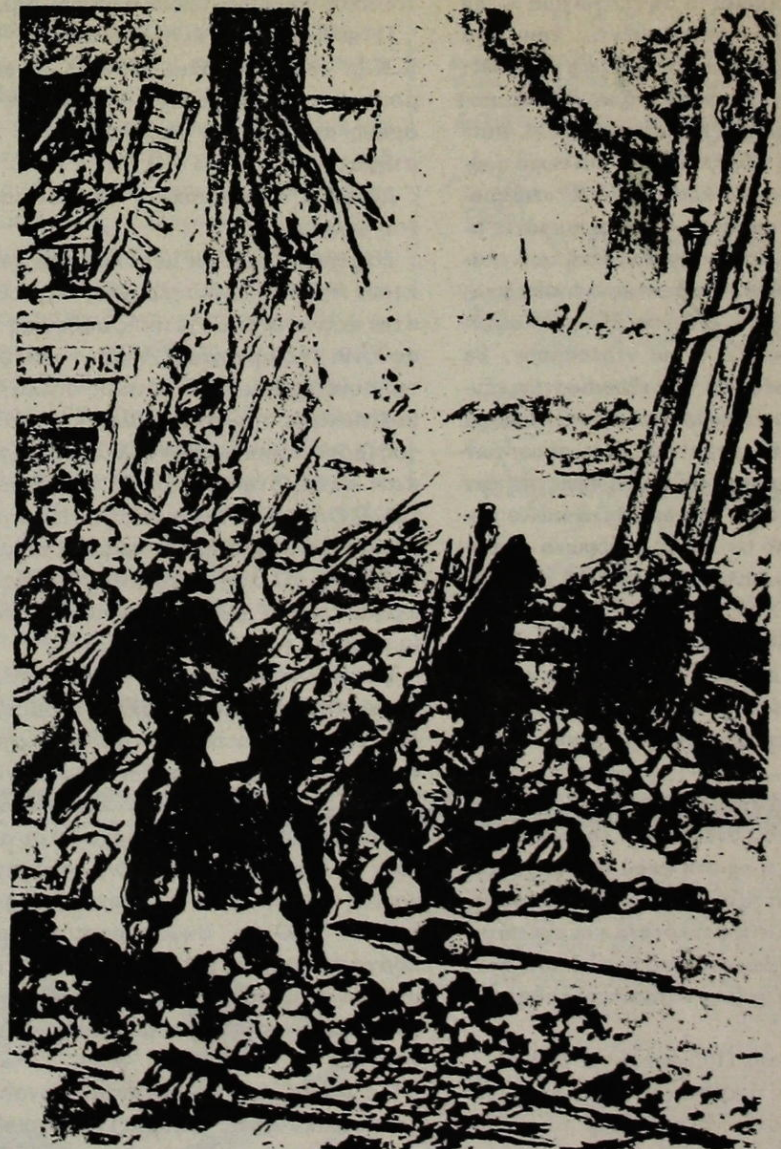
Υπεράσπιση οδοφράγματος (Σχέδιο φτιαγμένο στις 25 Μαΐου)

Άντ. Άρνώ, Μπιλλιορέτ Ε. Έντ, Φ. Γκαμπόν, Γκ. Ρανδιέρ