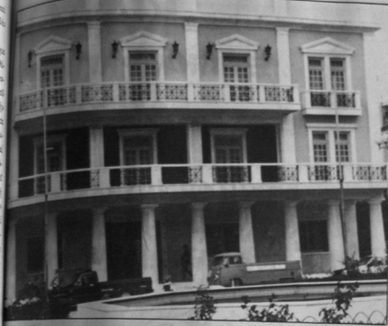
ΔΗΜΑΡΧΕΙΟ. ΔΩΡΕΑ ΤΟΥ ΕΦΟΠΛΙΣΤΗ ΛΑΤΣΗ...

«Ελευθερία χωρίς αποδοχή είναι προφάνως και αβυσσός. Ελευθερίας χωρίς αλληλεγγύη είναι κατάρα και βαρβαρότητα.»