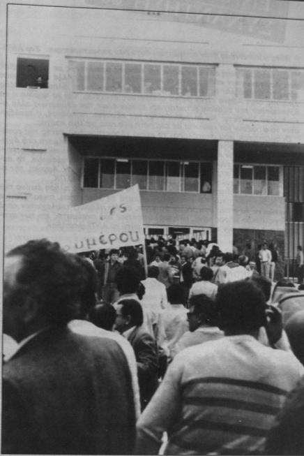
Από τη συγκέντρωση των εργαζομένων του Πέργου στις 21 Οκτωβρίου 1985 κατά των οικονομικών μέτρων του κεφαλαίου και του κράτους.