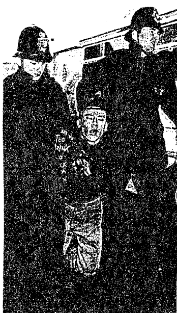
16/10/93: Αντιρρατσιστής διαδηλωτής συλλαμβάνεται από δργανα της "αυτής μεγαλειότητας" στο Λονδίνο.

Οι δυο αυτές ναζιστικές ομάδες, δηλαδή η Combat 18 και η Βρεταννική Αστυνομία ευθύνονται και για πολλές δολοφονίες ξένων μεταναστών και Αγγλων αντιρρατσιστών :