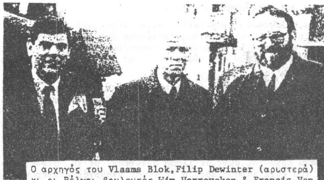
Ο αρχηγός του Vlaams Blok, Filip Dewinter (αριστερά) κι οι Βέλγοι βουλευτές Wim Verreycken & Francis Van der Eynde, στη διάρκεια επίσκεψής τους στην Κροατία.