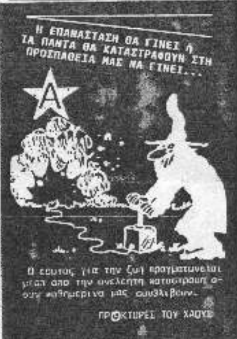
Η ελπίδα για την ζωή πραγματοποιείται μετά από την ανεξάντλητη καταστροφή ο- σων καθημερινά μας συμβαίνουν. ΠΡΟΚΙΝΕΙ ΤΟΝ ΧΛΩΜ

Στις 20/2/92, βίβλη εξέφραση στο κέντρο ΚΑΝ-ΣΑΝ, ο ιδιοκτήτης του σποίου, Γουό- γουόρδης, έχει σκευές σχέσεις με ακροδε- ξίους, νεοδημοκράτες, μαζικούς και με με- γαλόπλορους κομμουνιστές. Την ευθύνη της ευνοημάτων ανέλαβε η ΕΠΙΧΡΕΑΤΙΚΗ ΟΡΓΑΝΩΣΗ "Ε.Α.Α. - 1η ΜΜ".