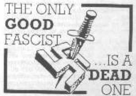
Produced by - DIRECT ACTION MOVEMENT (DAM MA) Anarchic-Synicalists P.O. Box 29 SW P.O. Manchester M13

θεί από κάποιον άγνωστο του αποστολέα. Λίγο αργότερα, αστόου, οι αντιρατσιστές έβαλαν στο χέρι κι άλλο έγγραφο, αυτή τη φορά γραμμένο εξ ολοκλήρου με το χέρι του Hasselbalch. Ο τίτλος του ήταν "Γιατί γράφουμε" και το περιεχόμενό του ήταν μια συλλογή οδηγιών για το πώς πρέπει να γράφονται οι προκηρύξεις της DDF. Ο Ολο Hasselbalch έβρισκε ότι "τα λόγια δεν είναι αρκετά για να σταματήσουμε τη μαζική μετανάστευση" κι ότι, σύντομα, η DDF θα "πάρει ν' αρχίσει να δρα μέσα στο σκοτάδι", "να ανοίξει στους δρόμους, για να επιβιώσει" κι ακόμη ν' αρχίσει να εφαρμόζει "βιολογικό σοσιαλισμό". Τα πρωτόκολλο της DDF κηρύσσονται εντελώς όταν επακαλύφθηκε ότι 3 ανώτερα στελέχη του D.N.S.E. ( Δανέζικα Εθνικο-Σοσιαλιστικό Κίνημα ) ήταν και μέλη της DDF. Επίσημα, βέβαια, η DDF εξακολουθεί να ισχυρίζεται ότι είναι αντίθετη στο ναζισμό. Οι αποκαλύψεις όμως, οδήγησαν σε διάσπαση. Ο νομιματιστής της DDF και οι περί αυτού έκοψαν τα γραφεία της ένωσης, ενώ ο Ολο Hasselbalch, μαζί με αρκετά τακτικά του έχει αναλάβει δικαστικούς την ηγεσία μιας οργάνωσης χωρίς μέλη. ( SORTS KØBS - ANARXISKE MÅRKE STANPØS DANJAS, Δεκέμβριος 1991 ).