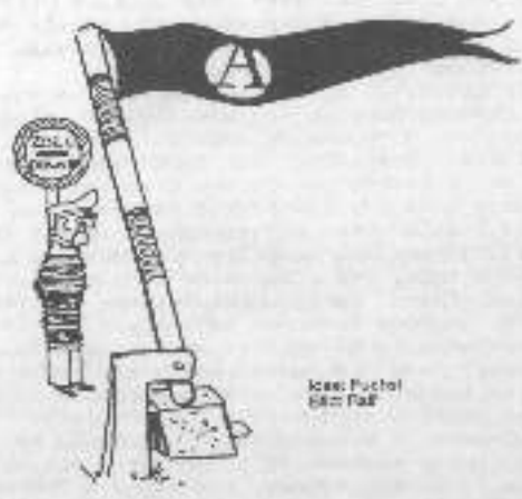
Icon: Puchol 64x 64x

"Ο ΑΝΑΡΧΙΚΟΣ" Δεν αποτελεί προϊόν που υποκείται στους εμπαικούς νόμους και ως εκ τούτου δεν απαιτείται για την απόκτηση του η καταβολή βραχυπρόθεσμου αντίτιμου. Η συνέχεια της έκδοσης του διασφαλίζεται με την εθελοντική προσφορά χρημάτων, εργασίας, κειμένων και ιδεών και όχι με την υποχρεωτική χρηματοδότηση που επιβάλλει η οποιαδήποτε τιμή πώλησης. "Ο ΑΝΑΡΧΙΚΟΣ" Δεν είναι φορέας απόμην μίας αναρχικής ομάδας. Κοινή αντίληψη όλων προαφέρουν για την έκδοση, είναι η ανάγκη διεύρυνσης της αναρχικής-αντιεξουσιαστικής πληρωμότητας. Έξω και πέρα από τους κρατικούς και εμπαικούς νόμους, ως γενεαίο δημιουργήμα της κοινωνικής εξέγερσης. Για την εγκαθίδρυση ενός κοινωνικού συστήματος που θα στηρίζεται στην αμοιβαία βοήθεια και την εθελοντική συνεργασία των μελών της. Ενάντια σ' όλες τις μορφές Επικυβέρνησης και οικονομικής καταπίεσης.