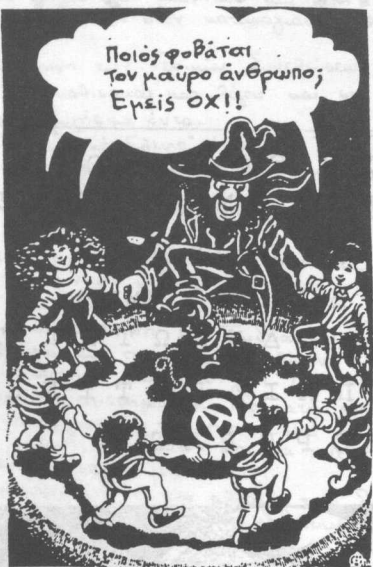
ΑΠΟ ΤΗΝ SCHWARZE-ROTE KALENDA '90

Στις 15-12-1990, 81 κρατούμενοι απέδρασαν από τις φυλακές Κορυδαλλού.