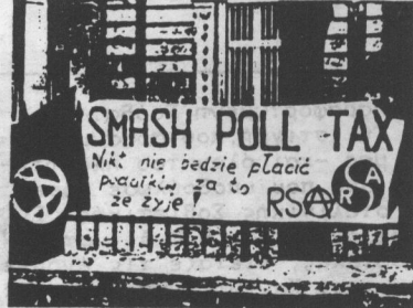
Piquet de solidarité anti Poll Tax - 31 mars 90, Varsovie

2/8/90: Ο Μαουρίτσιο Φολλίνι συλλαμβάνεται μετά από ένταλμα της Ιντερπόλ και αίτηση της Ιταλίας για έκδοση. Παρά το ότι το 1988 είχε αποφασιστεί ότι δεν θα εκδιδόταν, η δουλοπρεπής κυβέρνηση του Μητσοτάκη είναι πιθανό να τον εκδώσει, για να φανεί αρεστή στα ΕΟΚικά αφεντικά της. 3/8/90: Ο Φολλίνι προφυλακίζεται στον Κορυθαλλό. ΝΑ ΜΗΝ ΑΦΗΣΟΥΜΕ ΤΟΝ ΕΥΡΩΠΑΪΚΟ ΚΑΙ ΝΤΟΠΙΟ ΦΑΣΙΣΜΟ ΝΑ ΠΕΡΑΣΟΥΝ. ΛΕΥΤΕΡΙΑ ΣΤΟΥΣ ΧΑΜΝΤΑΝ, ΦΑΛΚΕΝΣΤΑΤΝ ΚΑΙ ΦΟΛΛΙΝΙ!