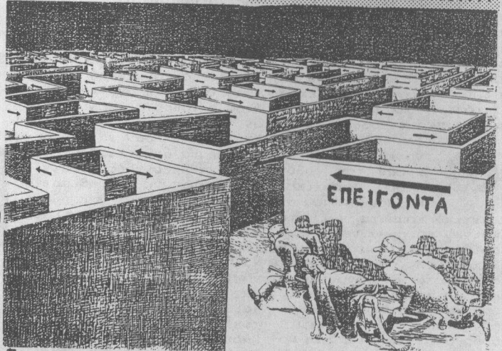
Προσφορά του "Αναρχικού" για τη Διάσημη της Οικουμενικής Οικονομίας... (Le Combat Syndicaliste Νοεμβρης 1989)

"Ο ΑΝΑΡΧΙΚΟΣ" δεν αποτελεί έσοδον που υπόκειται στους φορολογικούς νόμους, και ως εκ τούτου δεν απαιτείται για την απόκτησή του η καταβολή δασμολογικού αντιτίμου. Η συνέχεια της έκδοσης του διασφαλίζεται με την εθελούσια κρησφύρα κρημάτων, εργασίας, κειμένων και ιδεών και όχι με την υποχρεωτική χρηματοδότηση που επιβάλλει η οποιαδήποτε τιμή πώλησης. "Ο ΑΝΑΡΧΙΚΟΣ" δεν είναι φορέας απόψεων μιας ομάδας. Κοινή αντίληψη όλων προσφέρουν είναι η ανάγκη διεύρυνσης της αναρχικής πληροφόρησης πέρα και έξω από τους κρατικούς και εμπορικούς νόμους, ως γνήσιο δημιούργημα της κοινωνικής εξέγερσης. ΕΝΑΝΤΙΑ Σ' ΟΛΕΣ ΤΙΣ ΜΟΡΦΕΣ ΔΙΑΚΥΒΕΡΝΗΣΗΣ ΚΙ ΟΙΚΟΝΟΜΙΚΗΣ ΚΑΤΑΠΙΕΣΗΣ