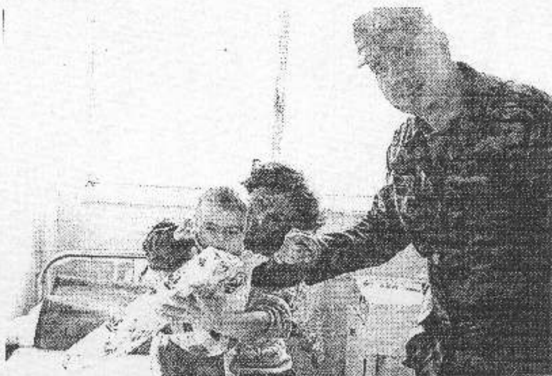
Πρωτοχρονιά του 2001, στο κατεχόμενο Κοσουφοπέδιο. Ο διοικητής των ελληνικών δυνάμεων κατοχής, Χρήστος Βαφειάδης, μοιράζει δώρα σε παιδιά - θύματα των ΝΑΤΟϊκών πυρηνικών όπλων - σε νοσοκομείο της Πρίστινα.

Φυσικά, εδώ γίνεται σαφής αναφορά σε βλήματα με ΟΥΡΑΝΙΟ (βλ. προηγούμενο τεύχος). Επισημαίνουμε την προσοχή των αναγνωστών στις χρονολογίες και στις ποσότητες των βλημάτων που θα παραχθούν. Διευκρινίζουμε ότι ο όρος "Boynaya Mashina Desantnika" αναφέρεται στα ρωσικά "Αερομεταφερόμενα Οχήματα", τεθωρακισμένα, μάχης, πολλαπλών χρήσεων κ.λπ. Κατό τα λοιπά, το κείμενο είναι σαφέστατο : "φονικότητα" της "πυροδότησης στην ατμόσφαιρα" του κυρίως ΟΥΡΑΝΙΟΥΧΟΥ βλήματος...".