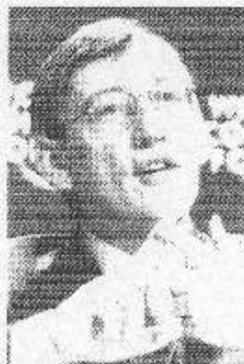
Hendrick A. Verfaillie, στέλεχος της εταιρίας Monsanto, που μεταλλάσσει γενετικά φυτά και ζώα, εμφανίστηκε τρομοκρατημένος, μετράει τα δάχτυλά του (μην του κόψαμε κανένα), κατά το πάρτι της εξουσίας, στο Davos.