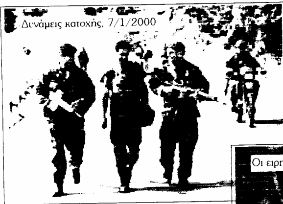
Δυνάμεις κατοχής, 7/1/2000