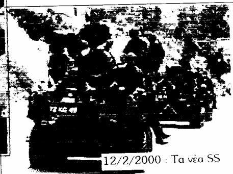
12/2/2000 : Τα νέα SS