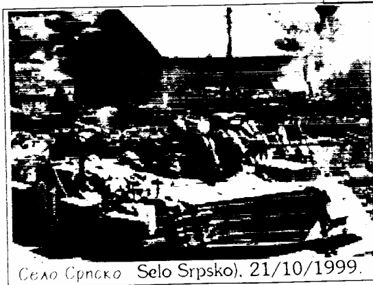
Σελο Σρπσκο (Selo Srpsko), 21/10/1999.

Φτάνει πια !!! Αμερικάνοι κι Ευρωπαίοι ανθρωπιστές ΑΕΙ ΣΤΟΝ ΔΙΑΒΟΛΟ !!!