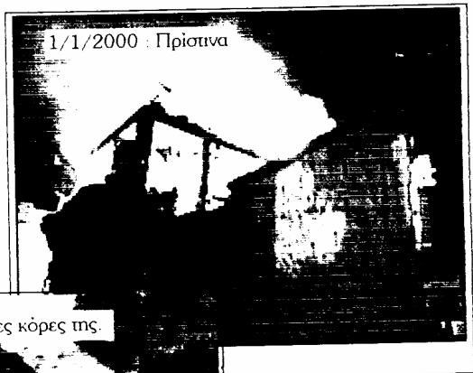
1/1/2000 : Πρίσινα

Οι ερηνευτές βίασαν τις ανήλικες κόρες της.