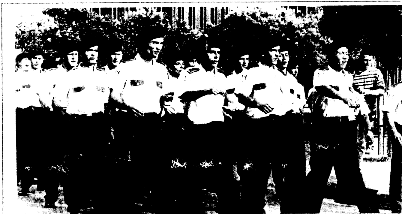
Ένα από τα «ελαττώματα» του Metin ήταν ότι φωτογράφιζε τις «φάτσες» των μπάτσων...