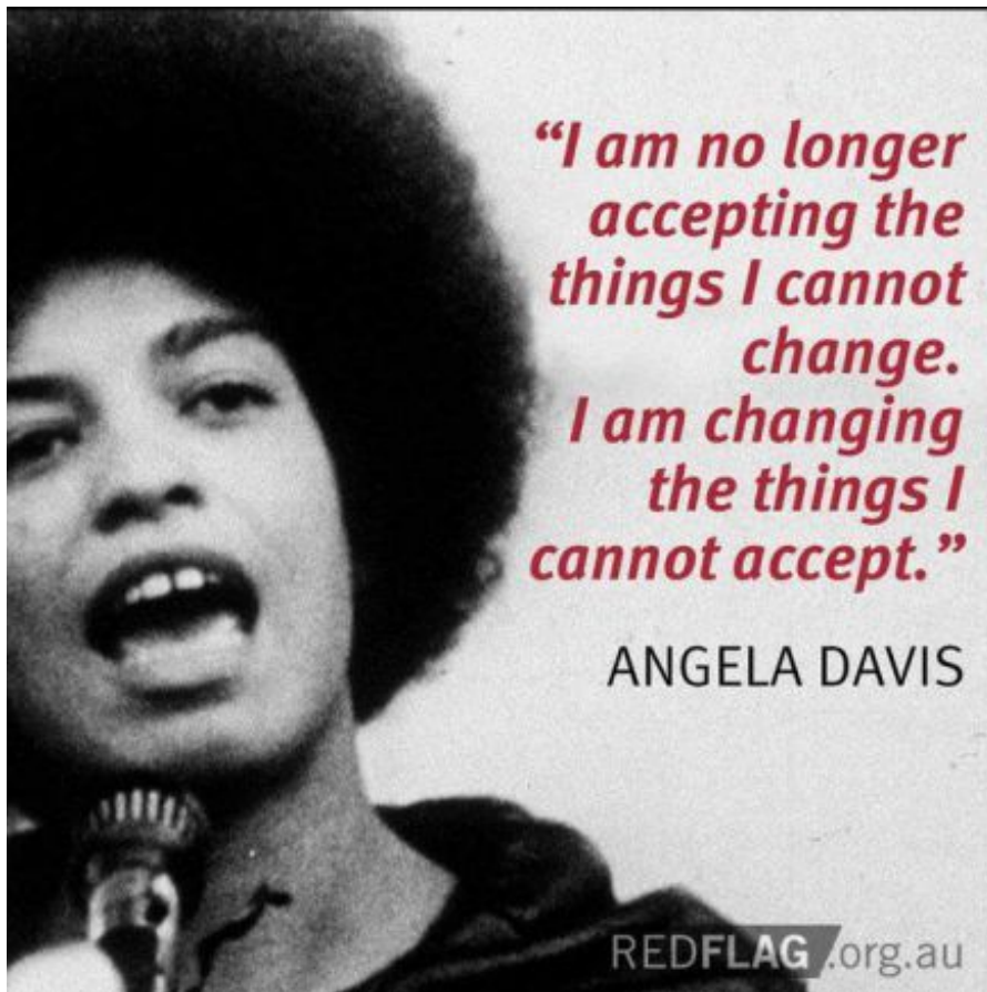
Angela Davis από τους Μαύρους Πάνθηρες.