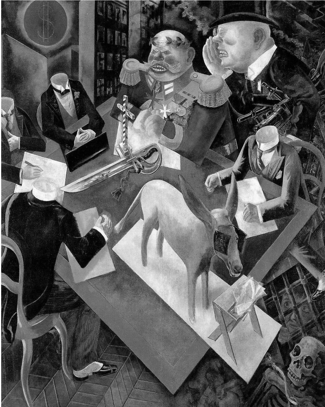
George Grosz: Eclipse of the sun , 1926