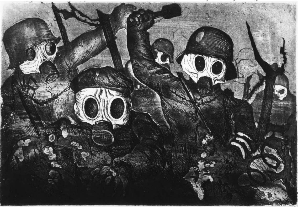
Otto Dix: Stormtroops advancing under a gas attack, 1924

Μέσα στην αμείλικτη πραγματικότητα που ζούμε δεν έχουμε τη δυνατότητα να κάνουμε ούτε βήμα πίσω , έχουμε όμως την ικανότητα να βαδίσουμε τα σωστά βήματα προς τα μπρος;